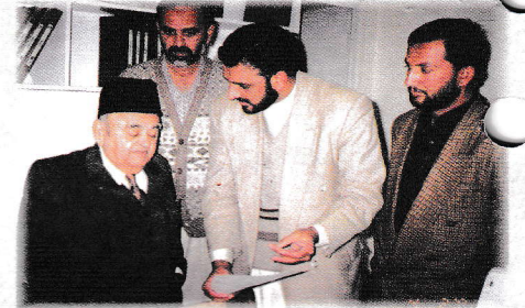
جینس (ر) نسیم حسن شاہ ہیڈ آفس آمد پر مختلف شعبہ جات کا دورہ کر رہے ہیں

سابق چیئر جینس اور چیئر مین حمایت اسلام فاؤنڈیشن جینس (ر) نسیم حسن شاہ نے ٹرسٹ کے ہیڈ آفس کا دورہ کیا۔