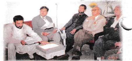
ممتاز قانون دان اہم ظفر ٹرسٹ کے بریفنگ سیشن میں شریک ہیں

ممتاز قانون دان اور پاکستان ہیومن رائٹس کے چیئر مین اہم ظفر نے ٹرسٹ کے ہیڈ آفس کا دورہ کیا۔ پروفیسر اشتیاق