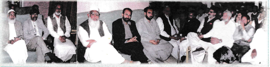
وہابی میں LACD کی تعارفی تقریب کے شرکاء