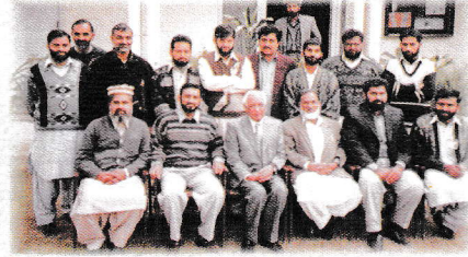
سابق وزیر اعظم پاکستان ملک معراج خالد کا ڈسٹکٹ سبڈیوژن پریکٹس کے ساتھ گروپ فوٹو

مشکلات سے آگاہی حاصل کی اور اپنے مکمل تعاون کا یقین دلایا۔ اخوان ایجوکیشن سوسائٹی اور غزالی ایجوکیشن ٹرسٹ کی جدوجہد سے دیہی پاکستان میں بڑے پیمانے پر تعلیم کا فروغ ہوگا۔ جدید تعلیمی کیسپس بنیں گے اور نسل نو کی تعمیر اور ترقی کے بارے میں امید افزاء حالات پیدا ہوں گے۔ ہیڈ آفس آمد پر سابق وزیر اعظم پاکستان اور