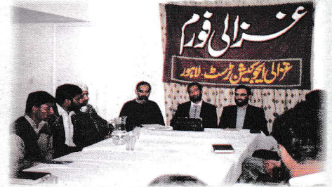
یورپ کے تعلیمی مشاہدات کے موضوع پر غزالی فورم سے حاضرین نے خطاب کیا۔

یورپ میں موجود پاکستانی کمیونٹی ہراس سرگرمی میں دل و جان سے تعاون کرنے کے لئے تیار ہے جو ملک میں تعلیمی پیش رفت اور شرح خواندگی میں اضافہ کے ضمن میں ہو۔ یہی وجہ ہے کہ پاکستانی سوسائٹی میں ٹرسٹ کے بارے میں زیادہ دلچسپی اور جوش کا